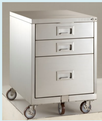
テーブル下キャビネット 3段