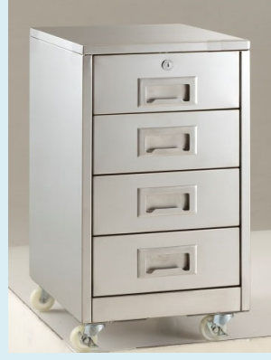
テーブル下キャビネット 4段