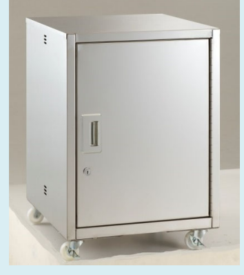
テーブル下キャビネット 片開