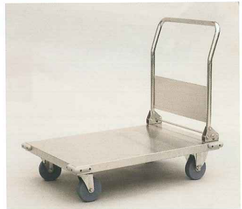
折りたたみ式ステンレス台車